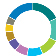
Répartition sectorielle (%)