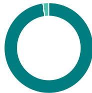
Répartition géographique (%)