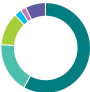
Répartition de l'actif (%)