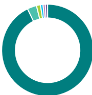
Répartition géographique (%)