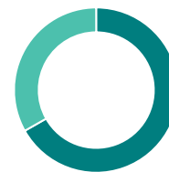
Répartition sectorielle (%)