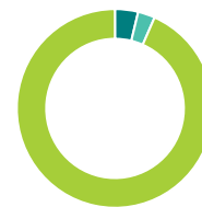
Répartition sectorielle (%)