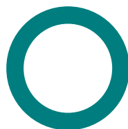
Répartition géographique (%)