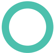
Répartition de l'actif (%)