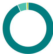
Répartition géographique (%)