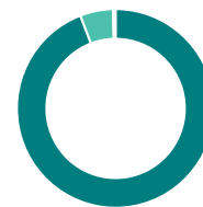
Répartition sectorielle (%)