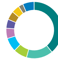
Répartition sectorielle (%)