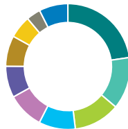
Répartition géographique (%)