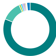
Répartition géographique (%)