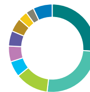
Répartition sectorielle (%)