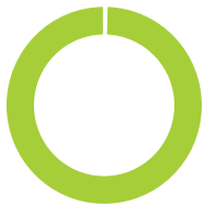
Répartition de l'actif (%)