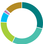
Répartition de l'actif (%)