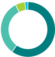
Répartition de l'actif (%)